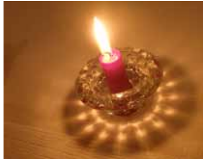
Bougie allumée prise avec et sans flash. Une même réalité ?

J'ai toujours aimé les jeux de niveaux de réalité. Lors de mes études de photographie aux beaux-arts, j'avais établi un dossier intitulé « Reflet d'une réalité, Réalité d'un reflet ».