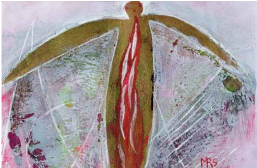
Ange de feu Monika R. Schmitz Technique mixte, 2008. 14,5 x 9,5 cm © Monika R. Schmitz

C'est un «outil sacré», qui ne s'exprime pas véritablement en mots, mais en images, en sentiments, en intuitions 5 ».