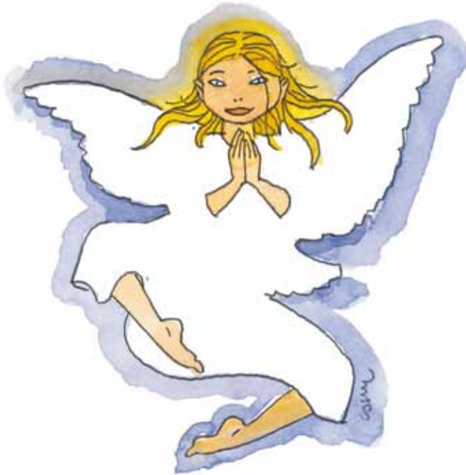
Ange, Cosey Aquarelle, 2009 21,5 x 19 cm

Cet auteur cher à mon cœur, par ailleurs, accepté de réaliser un dessin expressément pour ce livre. Qu'il en soit ici remercié.