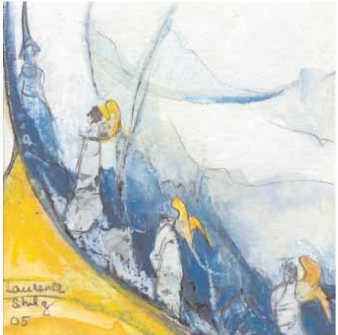
Laurence Stulz Les Anges de Saint-Marc , 2005 Pastel (15 x 15 cm)