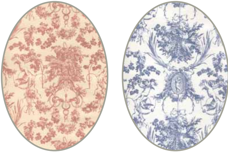
Détails de papiers peints début XX e siècle

encore autorisée à m'asseoir au volant d'une voiture. Après la descente prudente de la route de Berne, en abordant avec terreur le carrefour de La Sallaz, je l'apercevais en vigie, assis sur le capot.