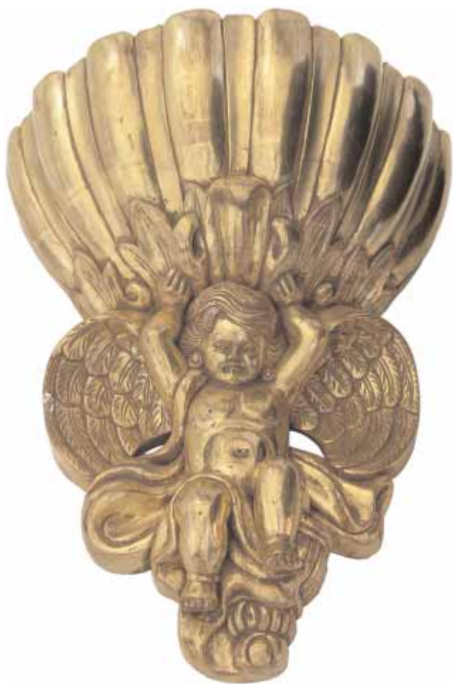
Applique XIX e siècle bois doré (30 x 25 cm)