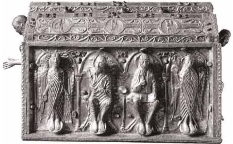
Grande châsse de saint Maurice (XII e -XIII e siècles) en or et argent. (Un séraphin et un chérubin figurent de part et d'autres du coffret) Abbaye de Saint-Maurice d'Agaune