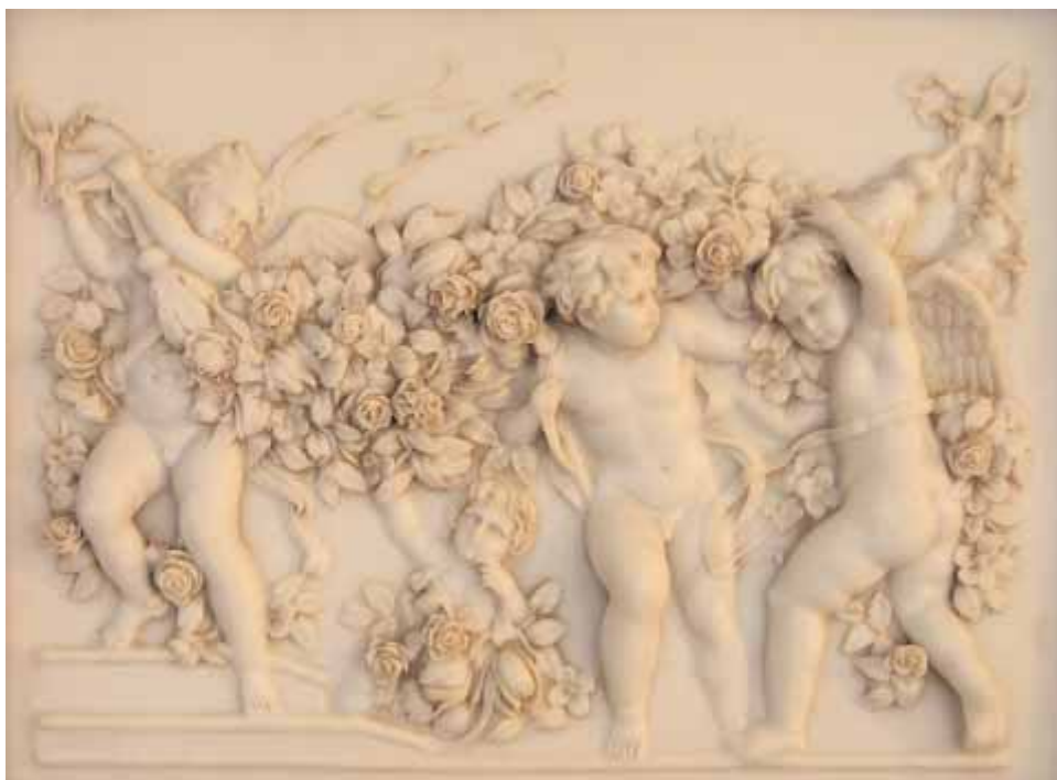
Trumeau de miroir avec motif anges bois, albâtre fin XIX e siècle (30 x 40 cm)