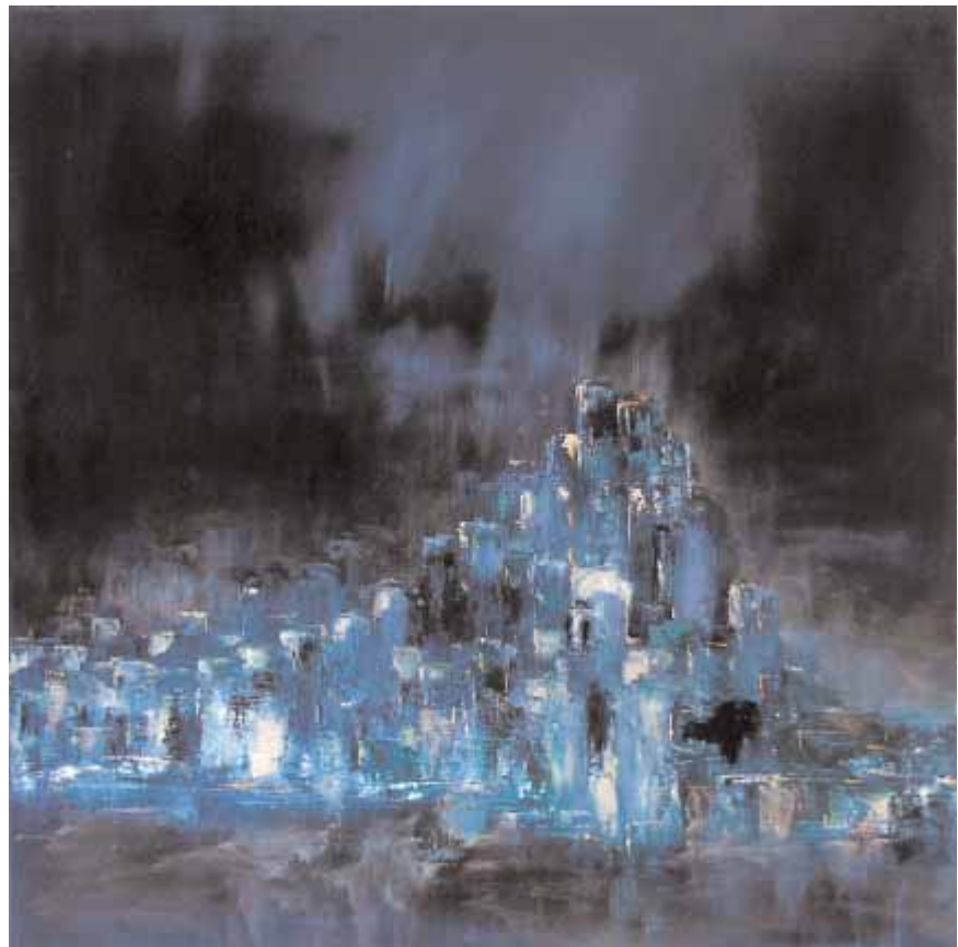
Mino La Cité des Anges , 2005 Acrylique (60 x 60 cm)